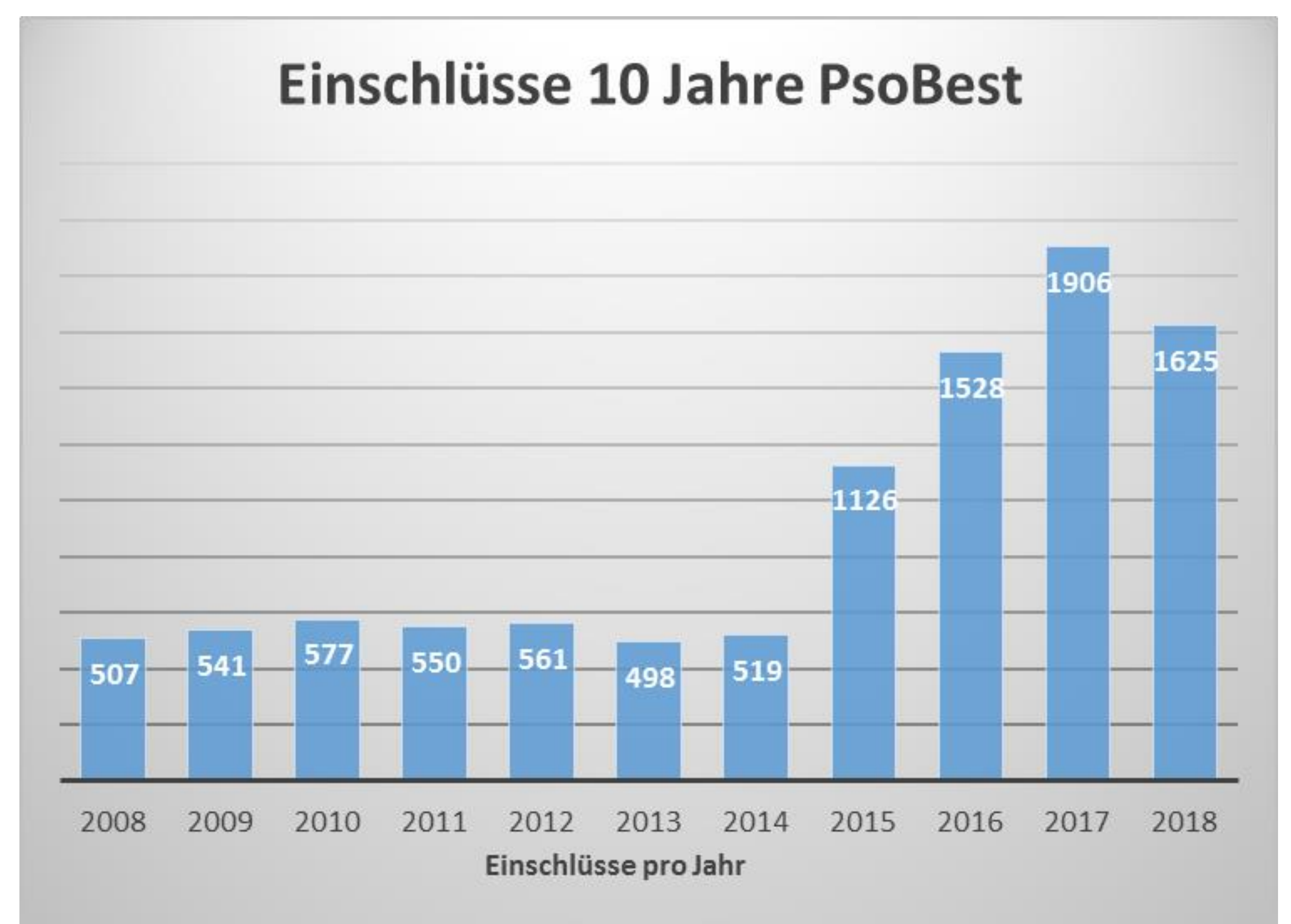
Abbildung 2: Einschlüsse 10 Jahre PsoBest

In den 10 Registerjahren wurden insgesamt 9938 Patienten eingeschlossen (Abbildung 2). Nach den ersten 5 Jahren war das Register in der Dermatologie gut etabliert, nach 7 Jahren stiegen die Einschussraten pro Jahr deutlich an. Da das Registerende nicht definiert wurde, rechnen wir weiterhin mit einer regen Beteiligung der Dermatologen und steigenden Patientenzahlen.